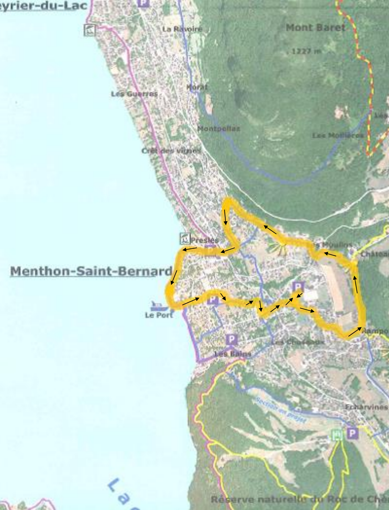
MENTHON RAID 2015 EPREUVE 1 - COURSE A PIED