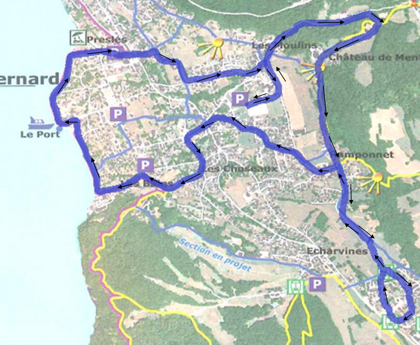
MENTHON RAID 2015 EPREUVE 3 – RUN & BIKE