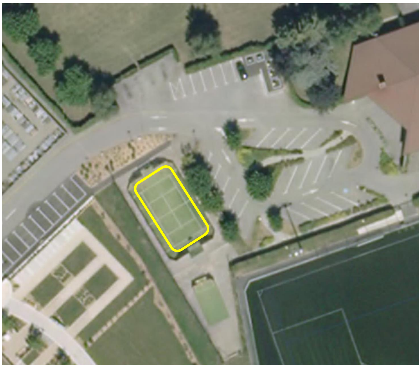
MENTHON RAID JUNIOR 2017 EPREUVE 3 - TIR A L'ARC